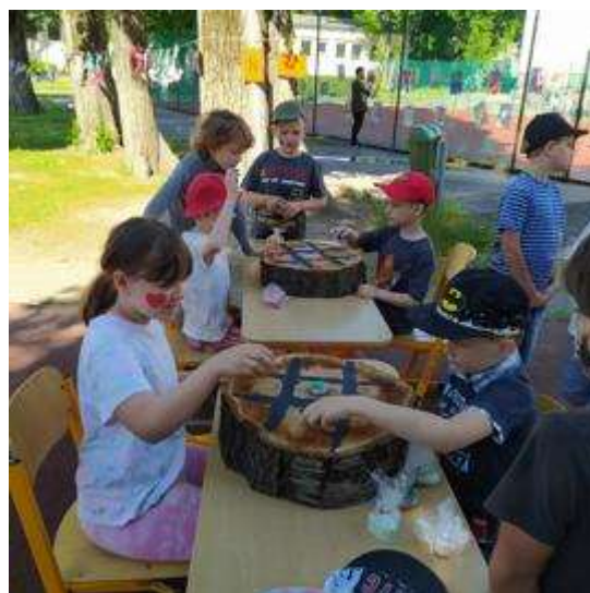
Deň radosti 2022