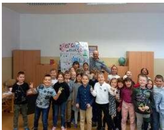
Beseda so spisovateľom P. Opet 2022