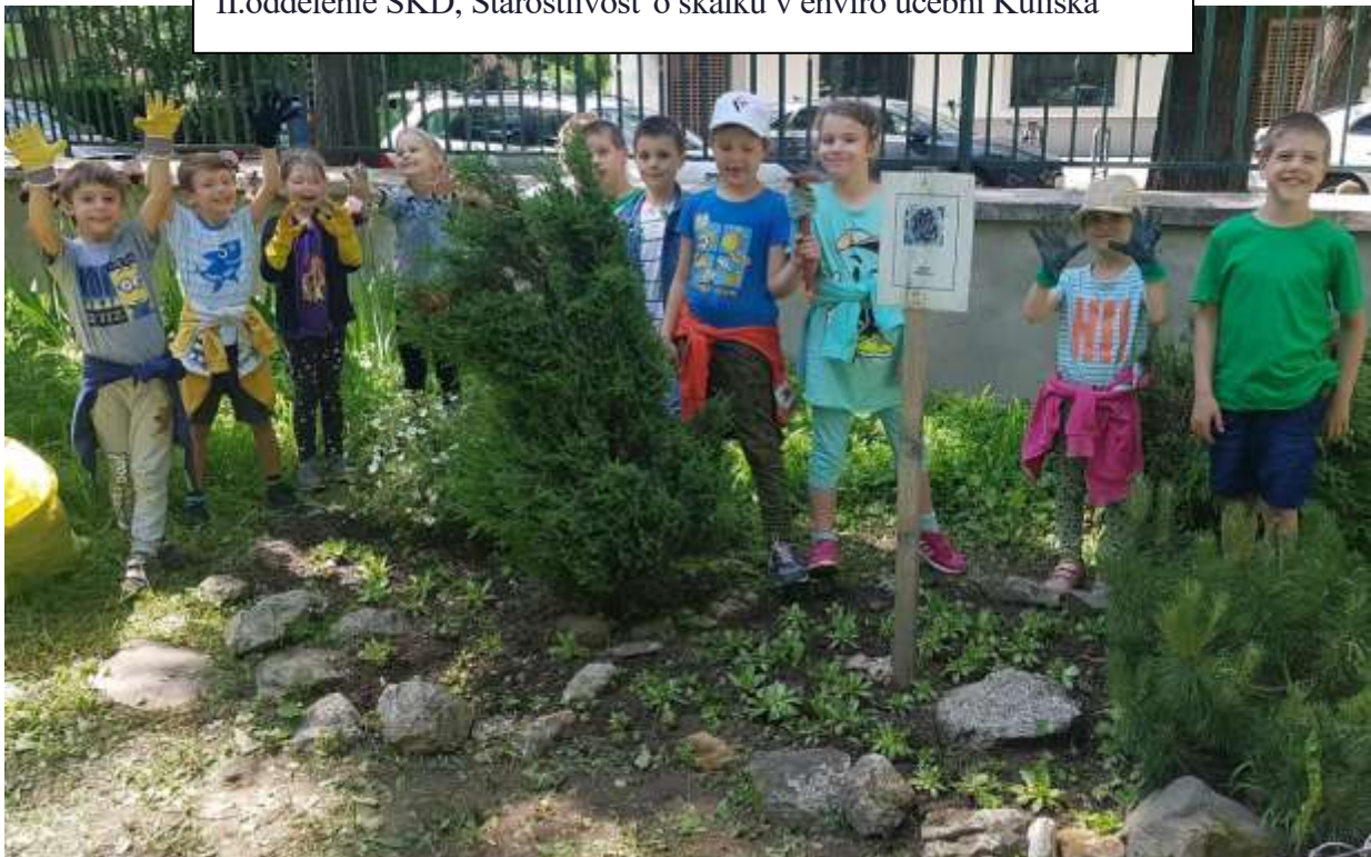
II.oddelenie ŠKD, Starostlivosť o skalku v enviro učebni Kuliška

Škola a jej zamestnanci sú v očakávaní, že plnenie úloh vo vzdelávaní, v rozvoji tvorivosti a pomoci školy aj zo strany rodičov a verejnosti – okolia školy, bude v súlade. Škola potrebuje mať vlastný pokojný priestor na plnenie úloh vzdelávacej a výchovnej činnosti stanovenej v SR a víta aktívnu pomoc rodičov a zriaďovateľa.