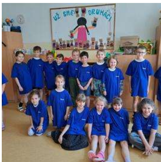
Týždeň farieb 2023